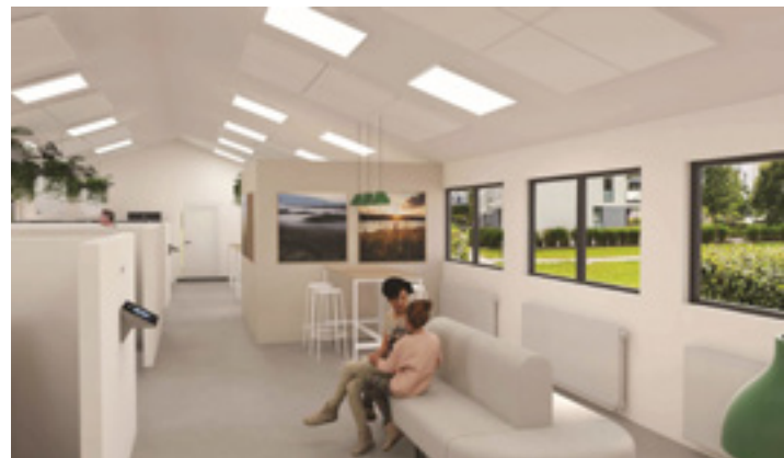
Nortecs rendering af, hvordan vaskerierne vil se ud efter renoveringen