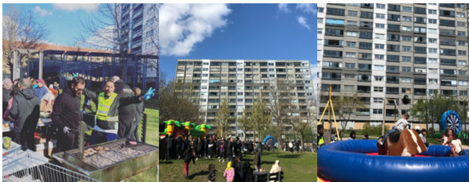
Fotos fra sidste års fest: DJ, fodboldturnering, rodeo og grillmad!