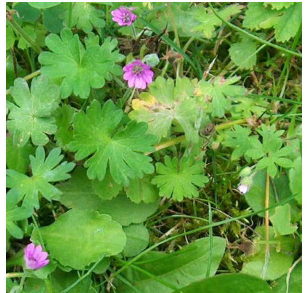
Liden Storkenæb, Geranium pycillum

Liden Storkenæb ansås tidligere som ukrudt i græsplænen men bliver efterhånden både accepteret og budt velkommen, sammen med andre urter, som har en niche i plænen.