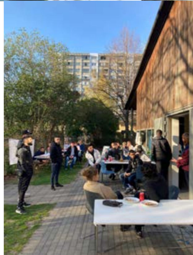
Aktivistmøder, maj og juni 2022