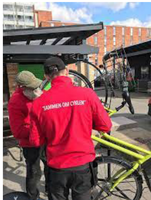
Foto | Sammen om Cyklens projekt i Hørgården, hvor mekanikerne er lidt ældre end i Lunden...