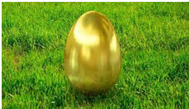
Foto | Aktivistmødets tema var at finde "Lundtoftøgades guldæg" i form af indtægtsgivende lejere til områdets parterre-rum og indbringende løsninger på regnvandsopsamling. Kom til de kommende aktivistmøder og hør mere!

Næste aktivistmøde er tirsdag den 5. december og invitationen kommer i næste uge!