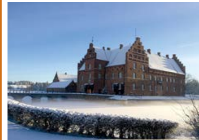
Gissfeldt Kloster i december

Med ønsket om, at vi får en rigtig dejlig tur sammen med mange hyggelige naboer, Fra os i Pusteren