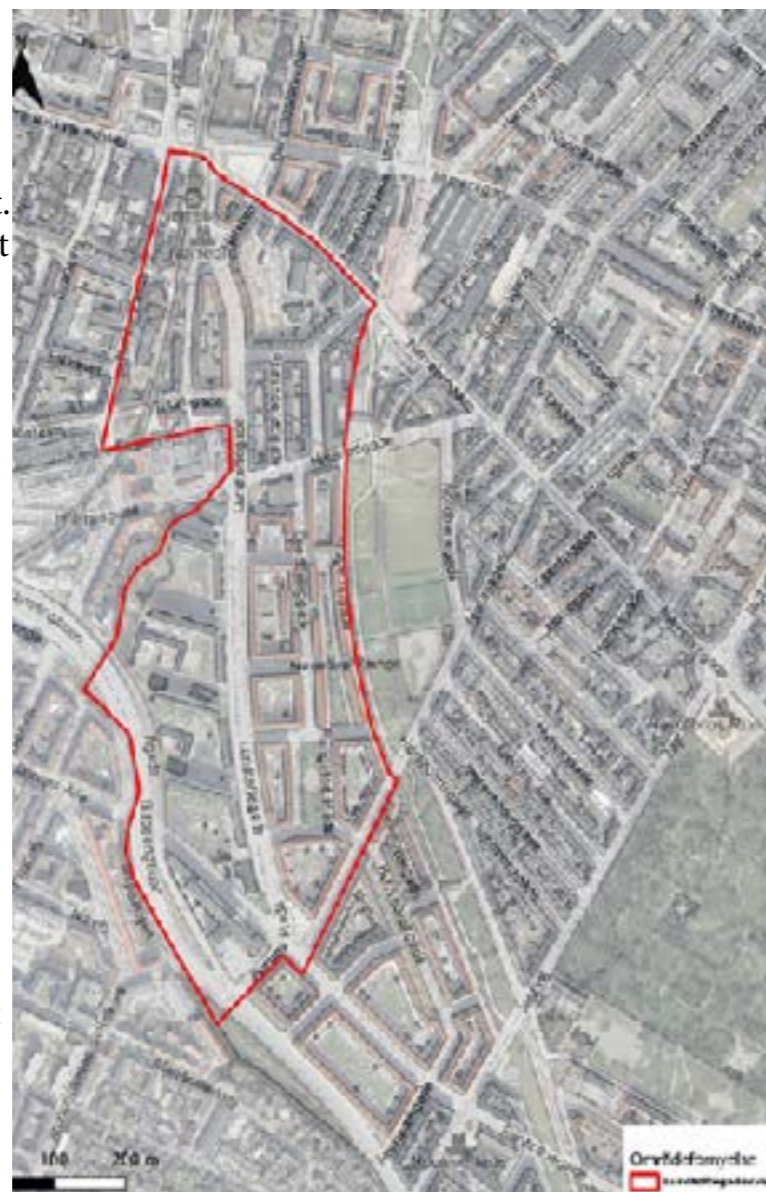
Området, som "Områdefornyelsen" dækker at

Sidst vil jeg opfordre til, at du også deltager i de kommende kvarter møder -som er et møde- og talerum der er skabt til os der bor her -hvor det hele skal ske!