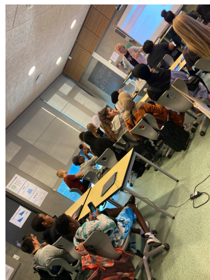
Højre: Undervisning fra lommepengejob-forløb, hvor unge lærer om hvad det vil sige at passe et arbejde.