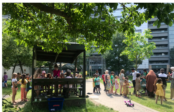
FerieCamp for børn, unge og familier i Lundtoftegade i sommerferien 2022.