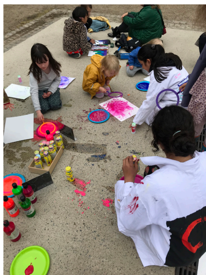
Venstre: Lundtoftedades ugenetlige kunstske, hvor lokale unge undervises på Copenhagen Contemporary.