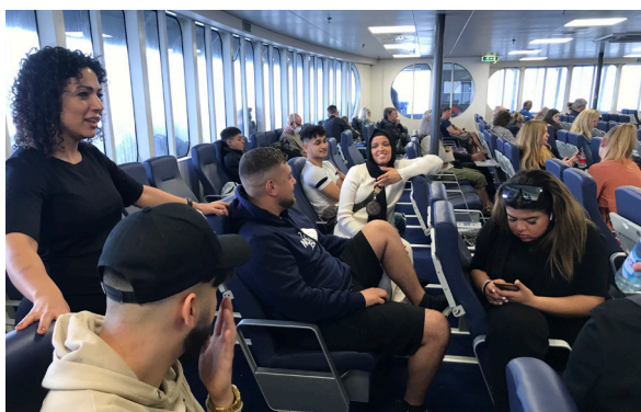
Udflugt med Opråb, et empowering-projekt for unge i boligområder.

Vi er fra Landsbyggefonden pålagt at prioritere fire indsatsområder om uddannelse, beskæftigelse, kriminalitetsforebyggelse og medborgerskab, og vi arbejder hele tiden på at forankre vores indsatser så de giver mening lokalt. Vi er bevidste om, at vi ikke kan tilgodese alle beboere, med de midler, vi har til rådighed og rammer, vi er underlagt, men vi lover at vi gør vores bedste for, at vores arbejde kommer så mange som muligt til gode.